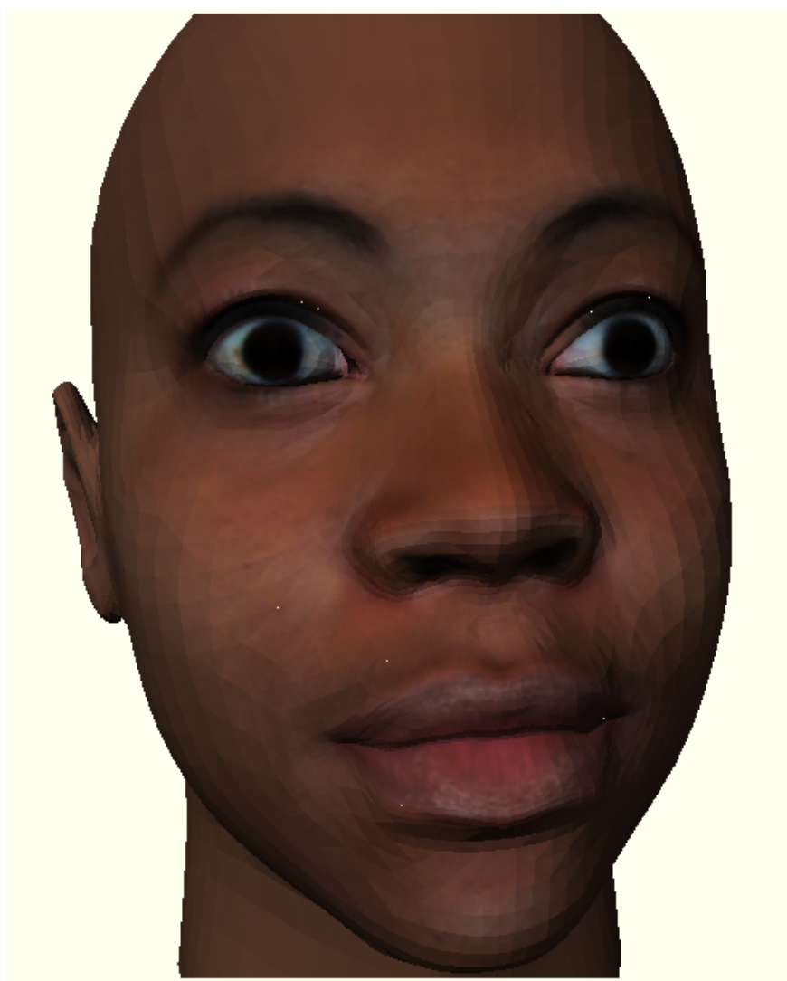
Рис. 2. Отверстия в модели при тесселляции

изменить количество вершин, содержащихся в их геометрии. Так как объект загружается в буферы WebGL при первом отображении сцены, то для обхода этой проблемы нужно было либо тесселировать объекты только один раз до необходимого размера ребра непосредственно после загрузки и до отображения сцены, либо динамически тесселировать объект, удалять его со сцены и пересоздавать. Преимущество первого метода над вторым в том, что он не затрагивает производительность приложения и несомненно является более простым в реализации, однако он не позволяет добиться динамической тесселляции, которая становится доступной при использовании второго метода. При разработке планировалось опробовать алгоритм тесселляции с использованием первого метода, а потом перейти на дина-