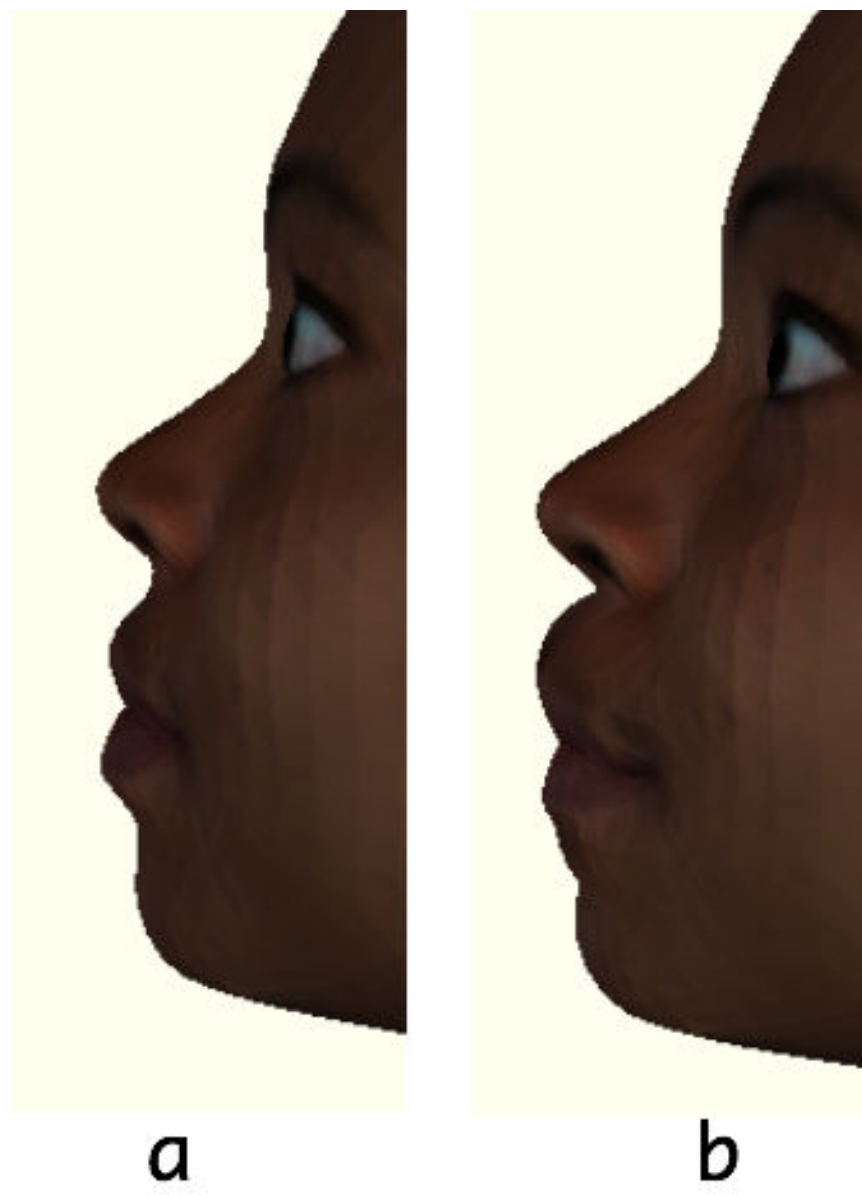
Рис. 1. Работа алгоритма для утолщения губ (результат справа)

становится неприемлемо низполигональной. Для устранения этого недостатка было решено использовать алгоритм тесселяции модели.